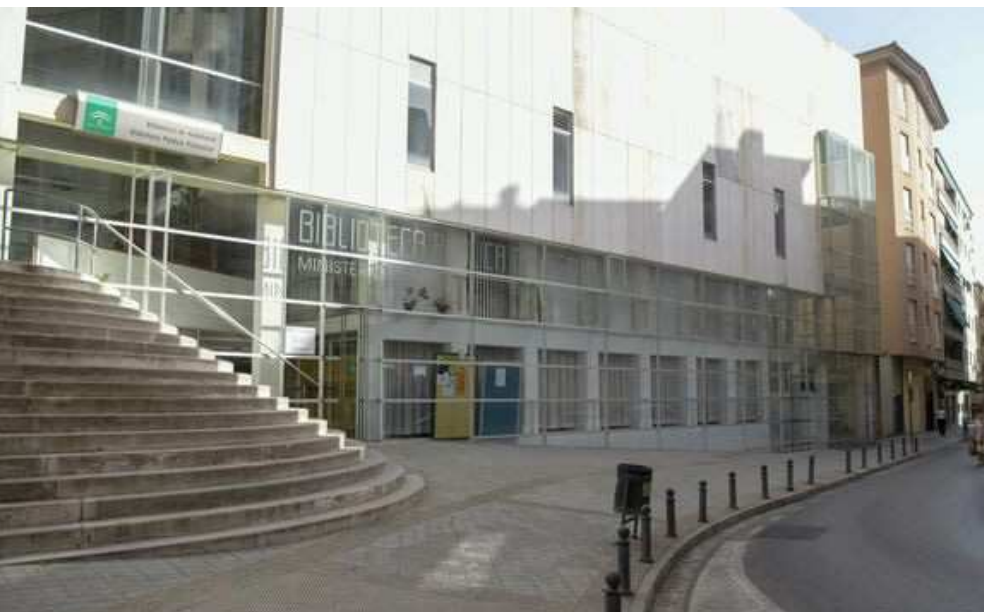
Biblioteca Pública de Andalucía