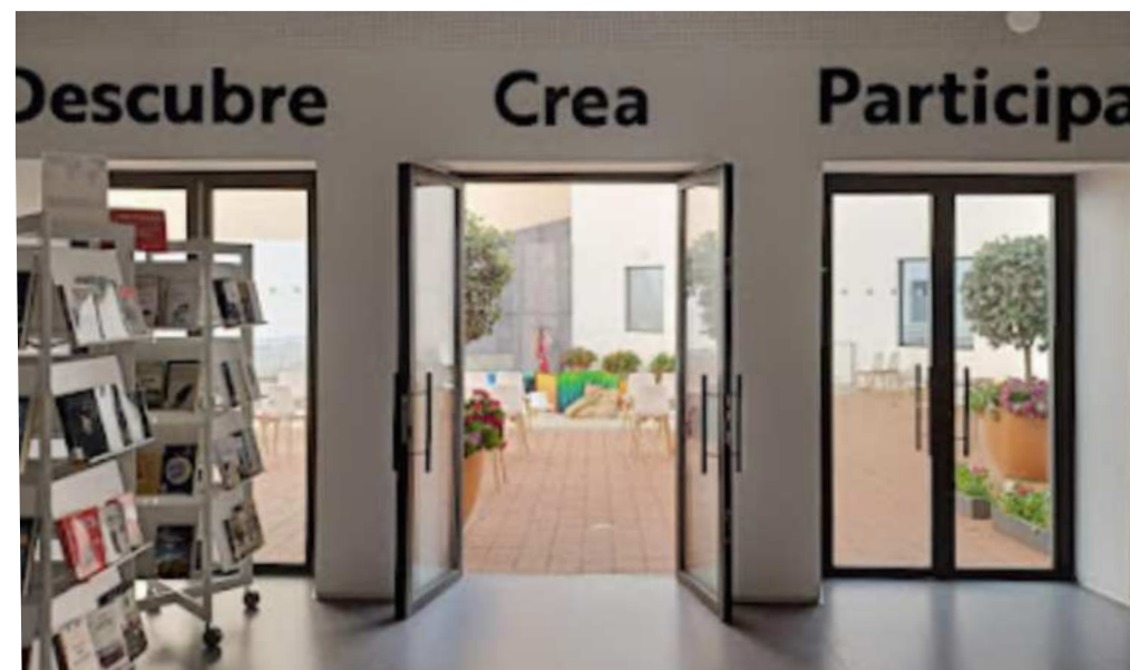
Biblioteca Municipal Central "José María Artero", Almería