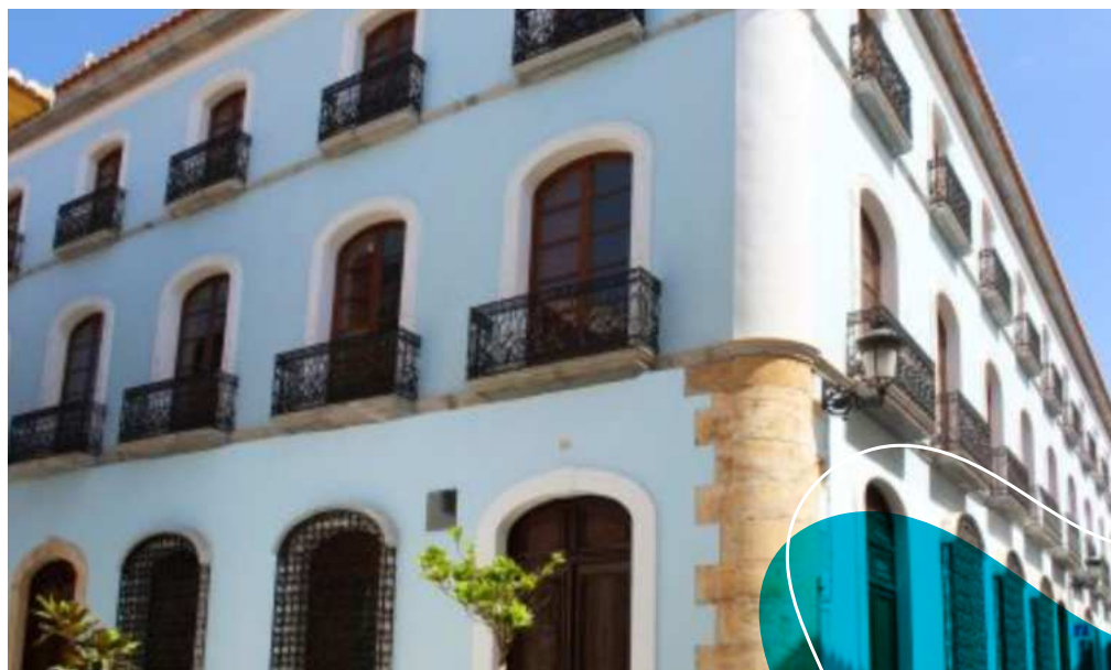
Biblioteca Pública de Berja