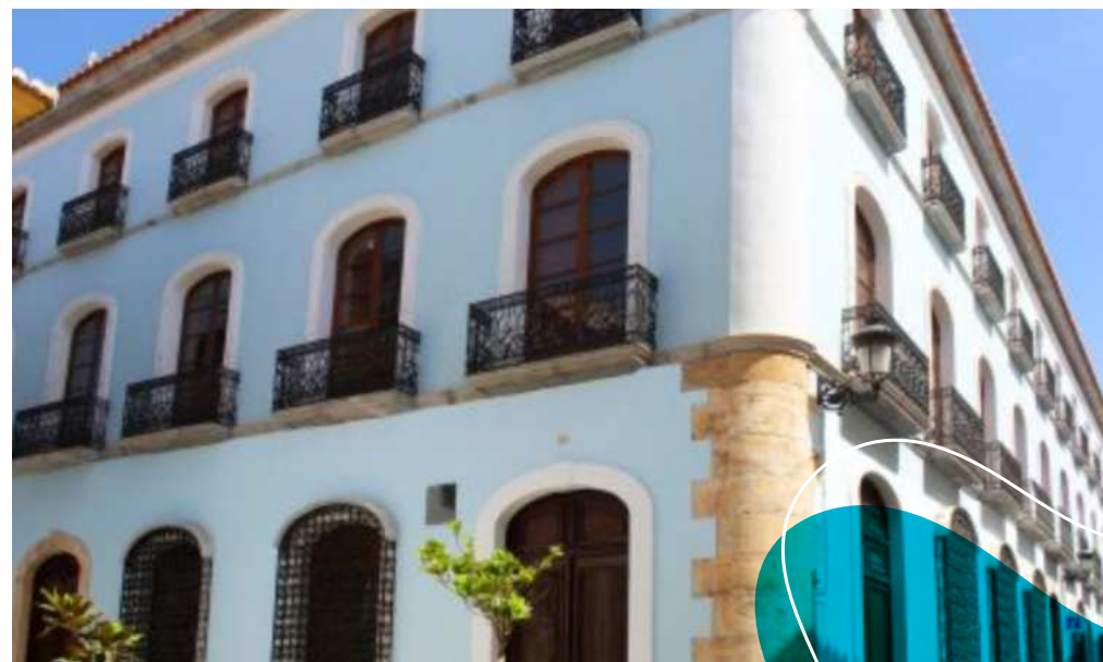
Biblioteca Pública da Berja