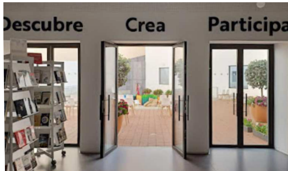
Biblioteca Municipal Central "José María Artero", Almería