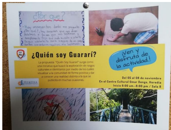
Cartel del Centro Cívico por la Paz de Garabito