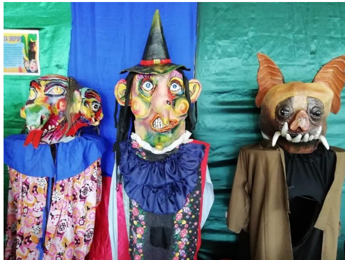
Muñecos populares en la biblioteca, en preparación del carnaval.

Creamos trazos sueltos, dibujando líneas sin levantar la mano, para luego identificar formas y resaltarlas en colores. A partir de estas figuras creamos poemas o micro-relatos. Oímos el testimonio de 3 jóvenes del taller de escritura y literatura de la biblioteca en el Centro Cívico, quienes nos contaron sobre su experiencia como asistentes del taller de literatura.