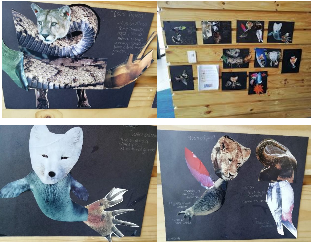
Collage que muestra el trabajo lúdico de fomento de la lectura a través de técnicas mixtas.