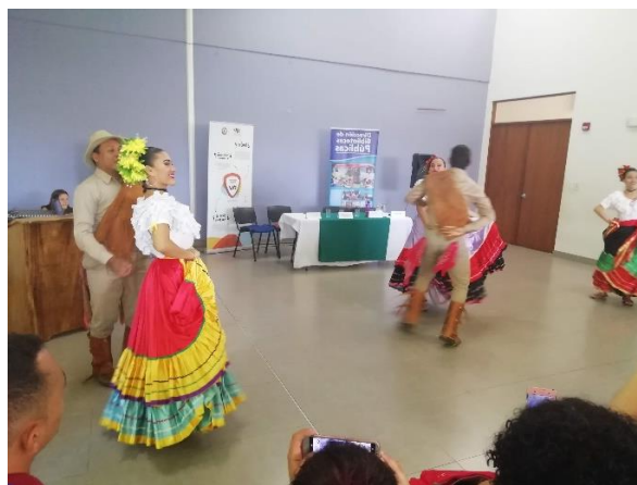
Danza tradicional de Costa Rica, Punto Guanacasteco

Nuestro primer día de pasantía, partió con un acto de bienvenida en el Centro Cívico por la Paz de Santa Cruz. En esta instancia pudimos escuchar a los equipos técnico políticos responsables de estos programas y pudimos disfrutar de la danza tradicional de Costa Rica.