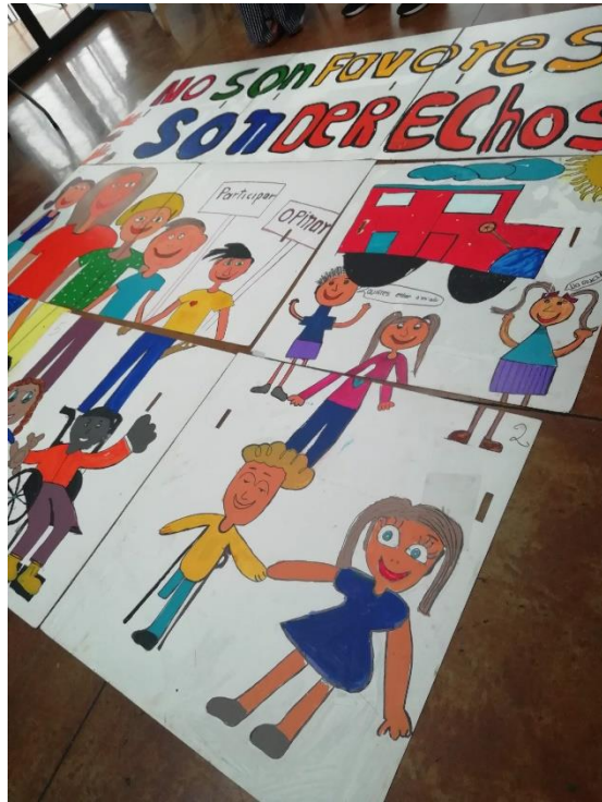
Obra de los usuarios, refleja el espíritu con que se trabaja la cultura de paz.