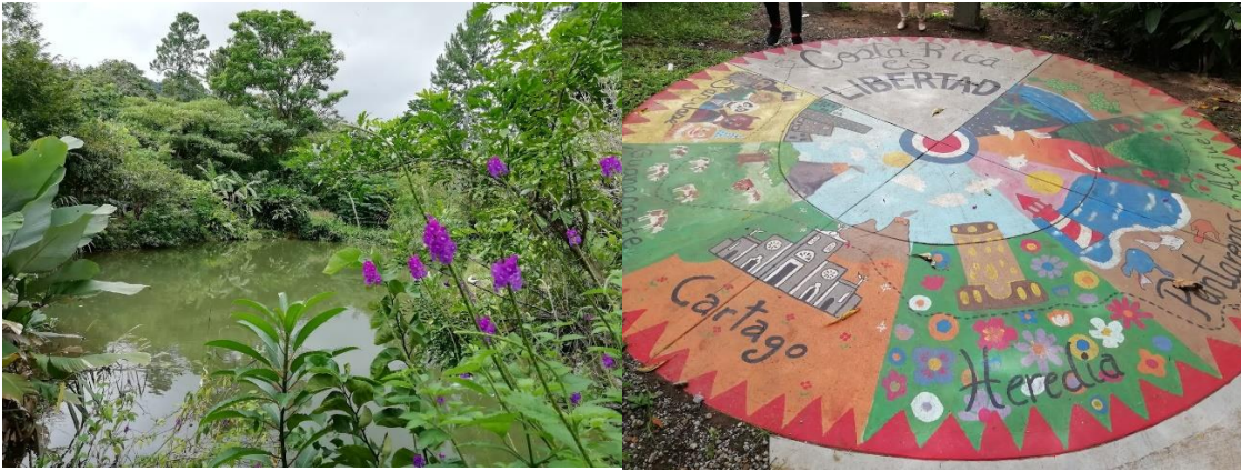
Jardines del Parque de la Libertad.

El cuarto día, visitamos el Parque La Libertad y la Biblioteca Nacional