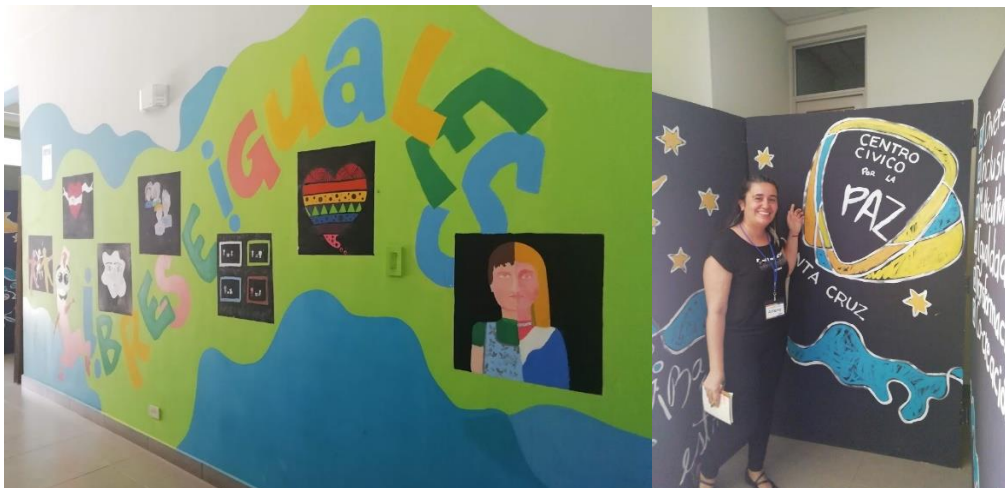
Decoración en paredes del Centro Cívico por la Paz de Santa Cruz.

comunidad, y en especial la niñez y la juventud, pueda disfrutar de espacios sanos y creativos de convivencia y crecimiento. Es un espacio libre de discriminación, violencia, drogas y alcohol. Prepara talleres de artes visuales y escénicas, talleres de música, biblioteca, Centro de Cuido y Desarrollo Infantil.