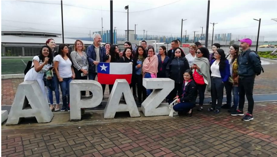
Foto colectiva en apoyo del proceso social de Chile 2019

El segundo día conocimos el Centro Cívico por la Paz de Garabito.