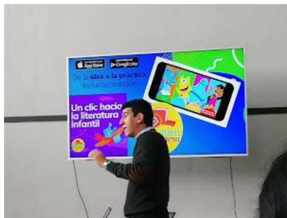
Expositor de la Carretica Cuentera.