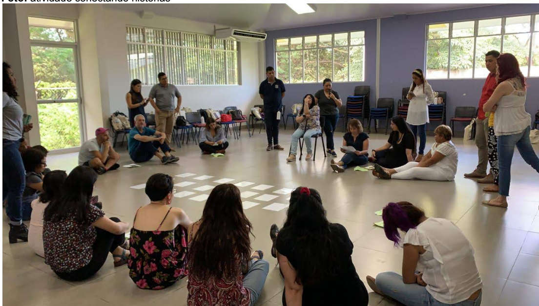
Foto: atividade conectando histórias

Importância da atividade: trabalhar a imaginação coletiva.