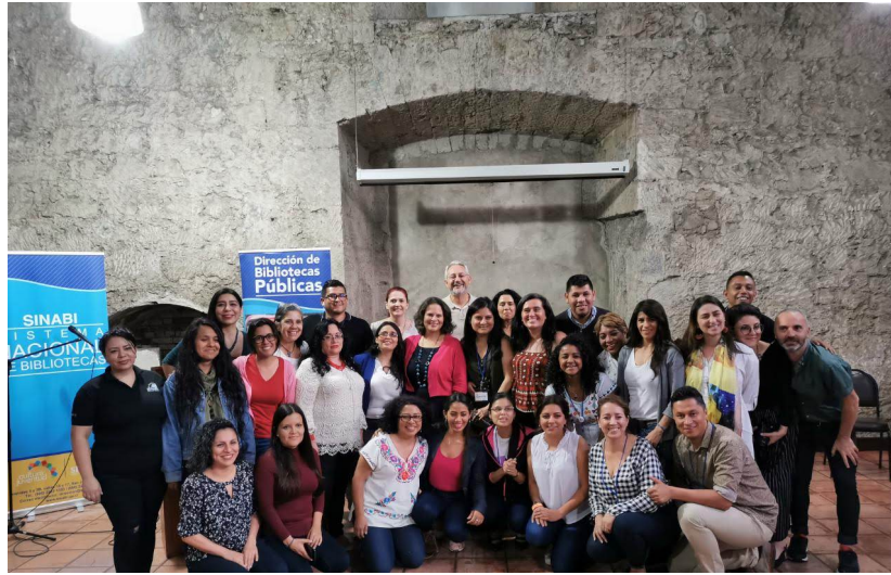
Foto: estagiários na noite de encerramento com a ministra