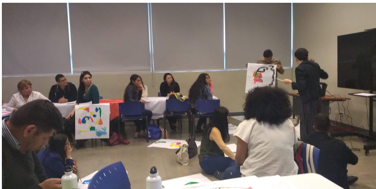
Foto: apresentação da atividade com pintura em Cartago

Foi muito gratificante ouvir e assistir os depoimentos.