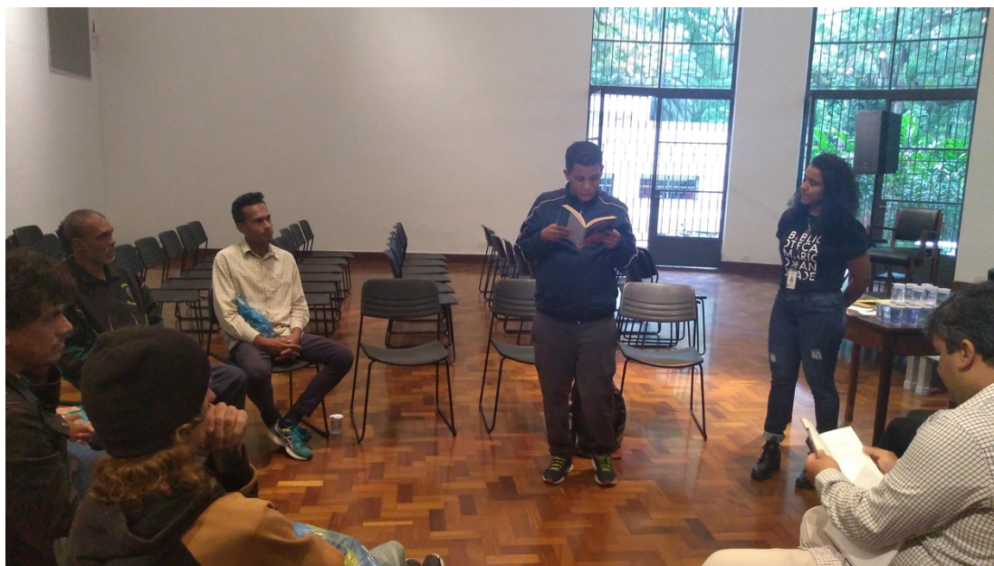
Foto: 2º oficina Mediação de Leitura para pessoas em situação de rua – BMA – nov.2019/ Tema: Racismo